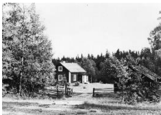
Boningshus och Uthus