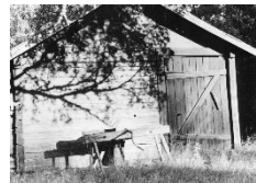
Loftbod med källare