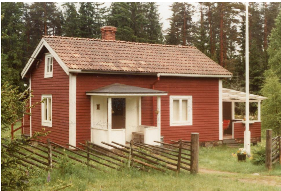
FRIDHEM, Skruf Södregård nr 142, Skruvby (Foto 1981)